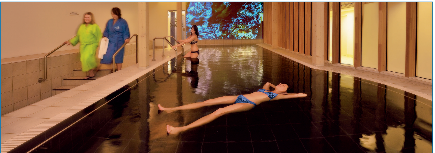
Heilbaden und Entspannungstherapie

*(Golf ist keine Kassenleistung, aber gegen einen geringen Aufpreis zubuchbar.)