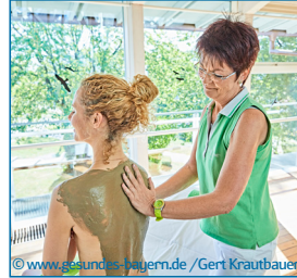
Physikalische Therapie z. B. Naturfango