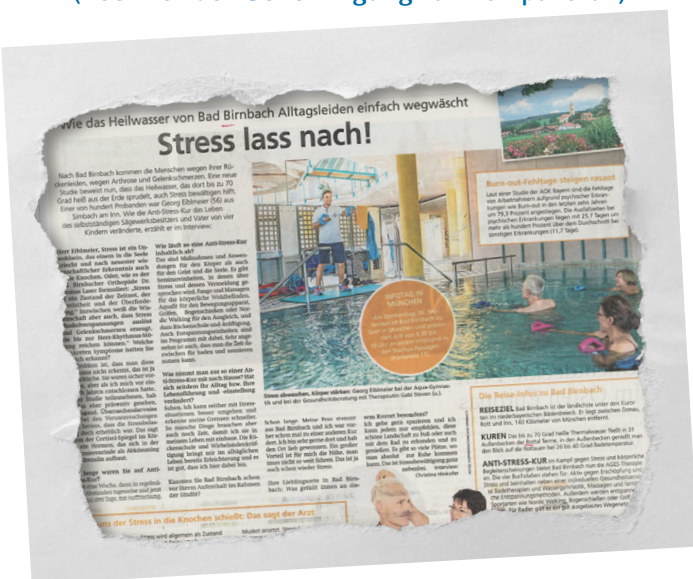
21. September 2019 - Münchner Merkur / TZ (noch vor der Genehmigung zur Kompaktkur)